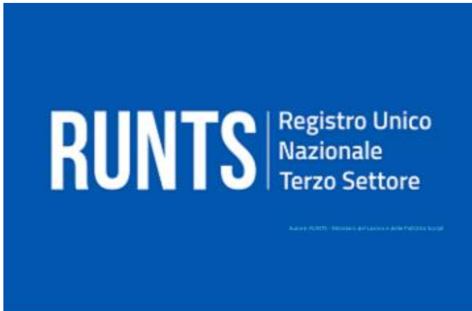
Figura n.2: immagine logo Registro Unico Nazionale del Terzo Settore