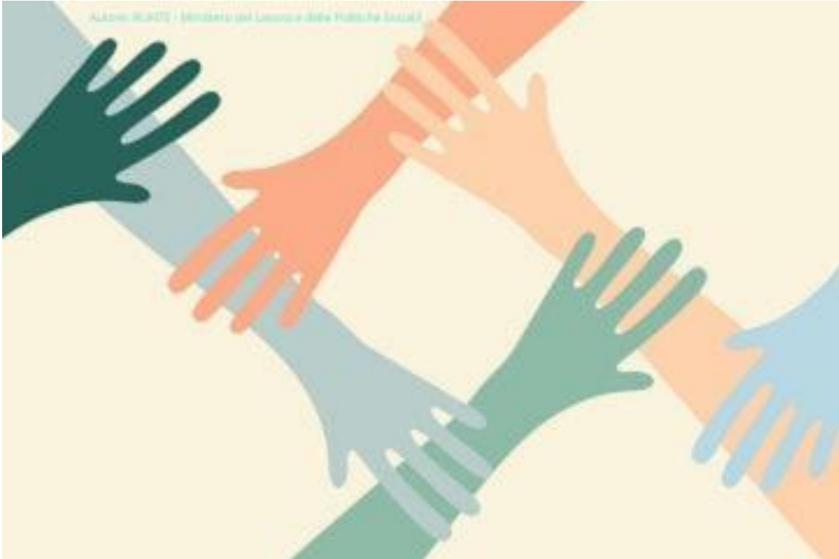
Figura n.3: immagine Enti del Terzo Settore