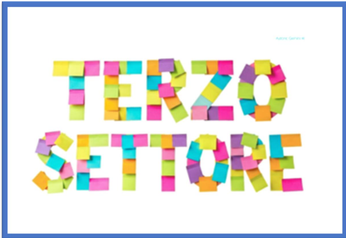
Figura n.4: immagine “Terzo Settore”